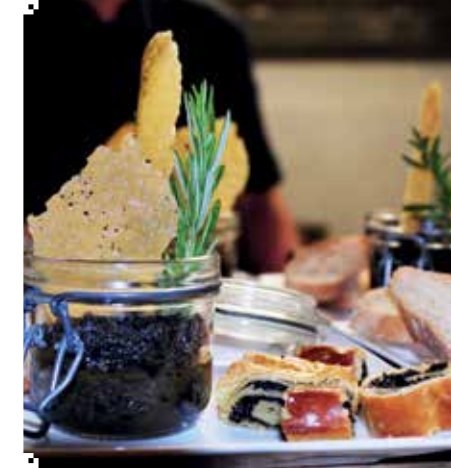
▲ DELIG: Ingen mangel på fristelser her.