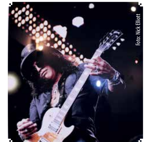
▲ KJENT FJES: Slash fra Guns N' Roses.