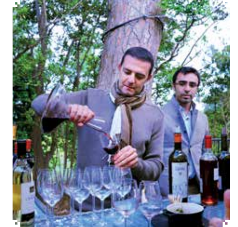
▲ HAGEPARTY: Slottshagen er altfor fin til ikke å bruke til selskapseligheter.

Denis O'Regan slo gjennom med 70-tallets punkbevegelse og har senere fotografert artister som Queen, The Rolling Stones, David Bowie, Duran Duran og Thin Lizzy. Han var også offisiell fotograf ved Live Aid og konserten for Prinsesse Diana.