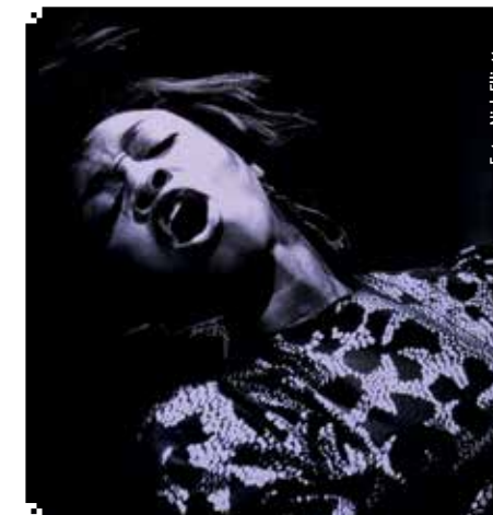
▲ VEGGPRYD: Beverly Knight under konsert.