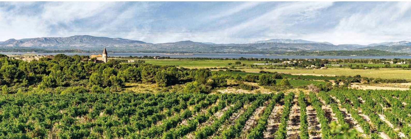
Erholung pur: Das satte Grün der Weinberge und das tiefe Blau des Wassers bestimmen den herrlichen Blick in die Ferne