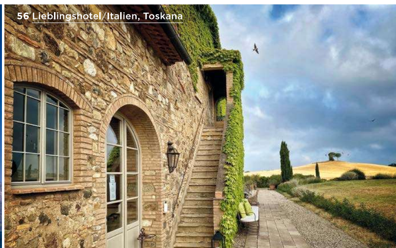
56 Lieblingshotel/Italien, Toskana